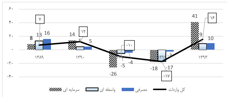
نمودار ۱- رشد نه ماهه ارزش دلاری واردات گمرکی نسبت به دوره مشابه سال قبل (درصد)